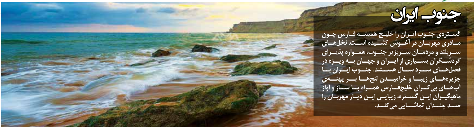
چابهار-ساحل مینرای روستای رومن - فراتر از احمد عباسی

گسترده‌ی جنوب ایران را خلیج همیشه فارس چون مادری مهربان در آغوش کشیده است. نخل‌های سربلند و مردمان سربزیر جنوب، همواره پذیرای گردشگران بسیاری از ایران و جهان به ویژه در فصل‌های سرد سال هستند. جنوب ایران با جزیره‌های زیبا و خرامیدن لنج‌ها بر پهنه‌ی آب‌های بی‌کران خلیج فارس همراه با ساز و آواز ماهیگیران این گستره، زیبایی این دیار مهربان را صد چندان تماشایی می‌کند.